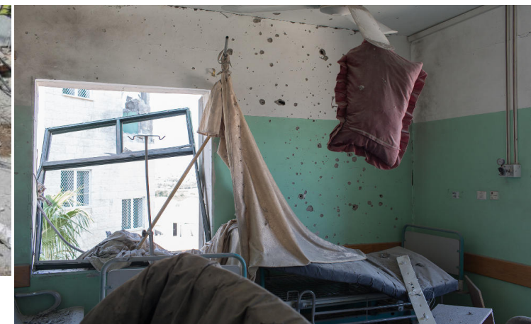
Ospedale al-Aqsa, nel quartiere di Shuja'ya a Gaza City, bombardato da Israele. 4 morti e 16 feriti, in uno dei tanti ospedali presi di mira.

Un farmaco è un bene destinato alla cura delle malattie ed a salvare vite umane; esso è quindi uno strumento con un alto contenuto etico, che perde questo valore quando contribuisce al bilancio nazionale di paesi i cui governi si macchiano di crimini orribili ai danni di popolazioni pi ù deboli. Quindi: